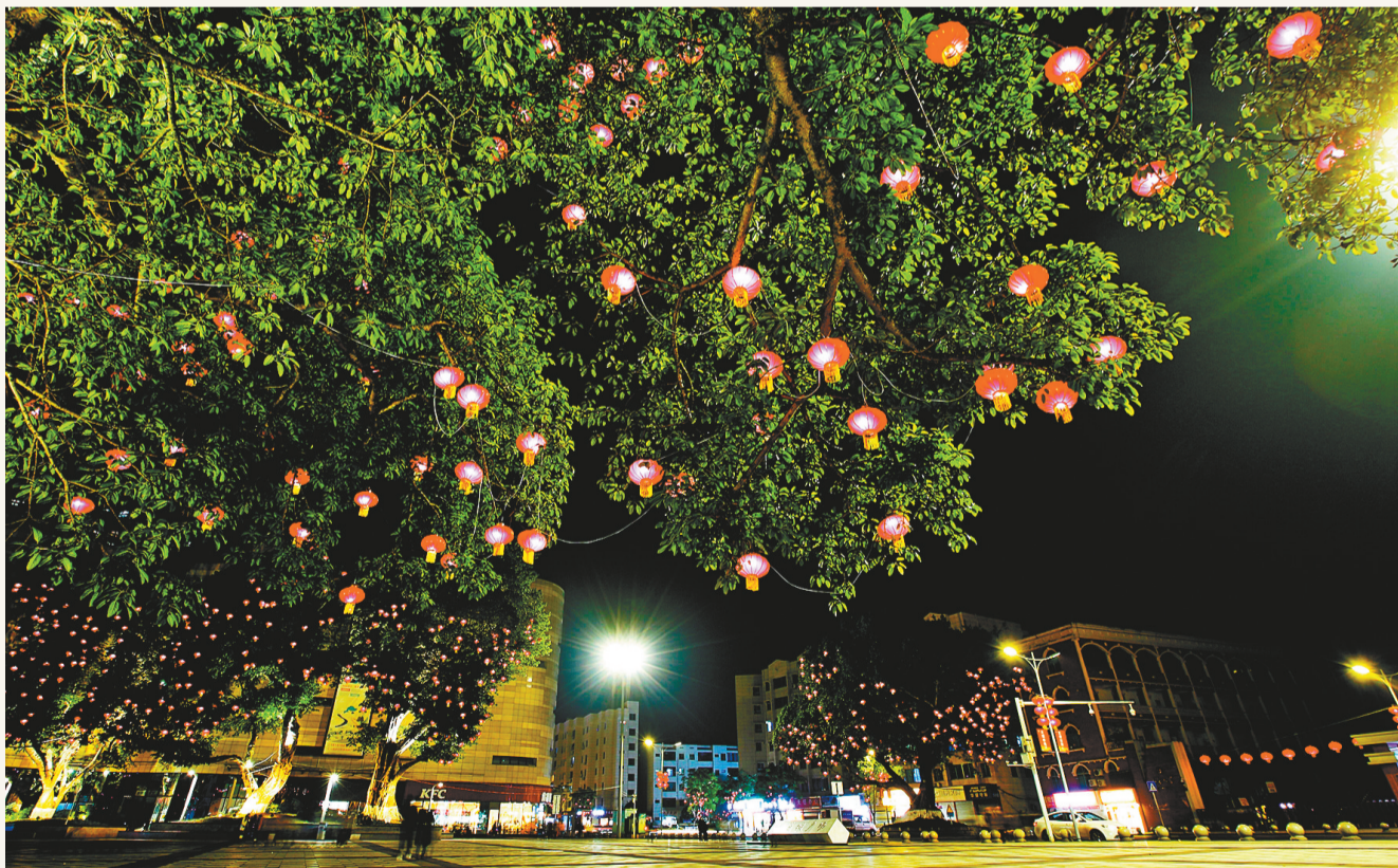
新春灯饰闪耀棠城

融媒体中心记者 张泽美 杨 丽丹 刘佳佳 刘雨桐 向虹霖 廖国颖 王新莲 何文杰 蒋坤 红 张 丹 金红梅 张 强