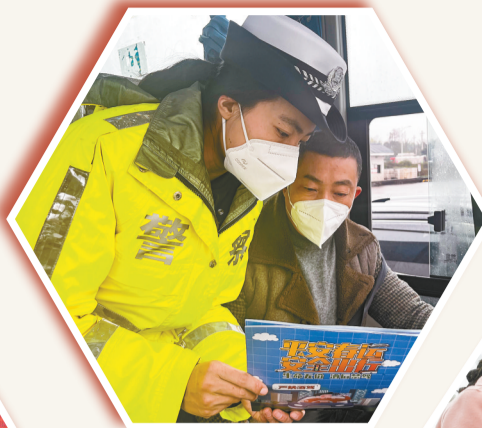
民警向司乘人员宣传安全出行相关知识

交巡警提醒,春运期间,交通流量骤增,请市民提前规划路线,尽量错峰出行。驾车出行时,提前检查车辆安全性能并关注交通路况信息和