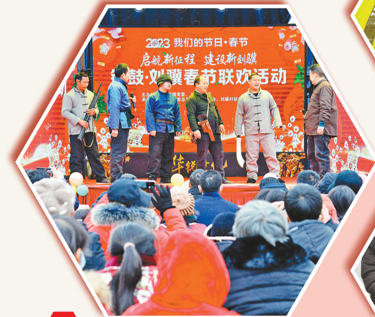
铜鼓群众自编自导春节联欢活动

连日来,吴家镇全体机关干部、村(社区)干部和群众代表等200余人,组成“迎新年环境卫生整治小分队”,到辖区8个村(社区)开展人居环境整治活动,以干净整洁的环境迎接新年到来。