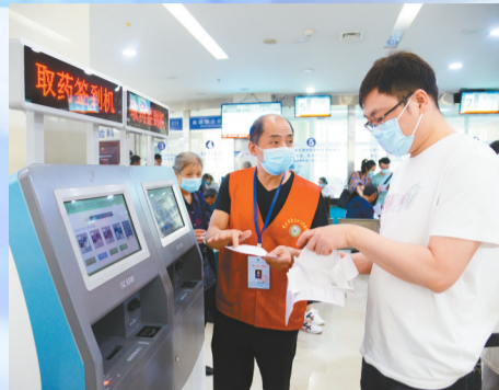
▲志愿者帮患者在取药签到机上签到 ▲医护人员检查产如情况

有了人才加持,该院新增肿瘤科、儿童保健科等一、二级诊疗科目27个;新增重庆市临床重点专科和重庆市区域医学重点学科各1个;获批重庆市区域医学重点学科和重庆市公共卫生重点专科建设项目立项各1个;新增立项腹腔镜联合